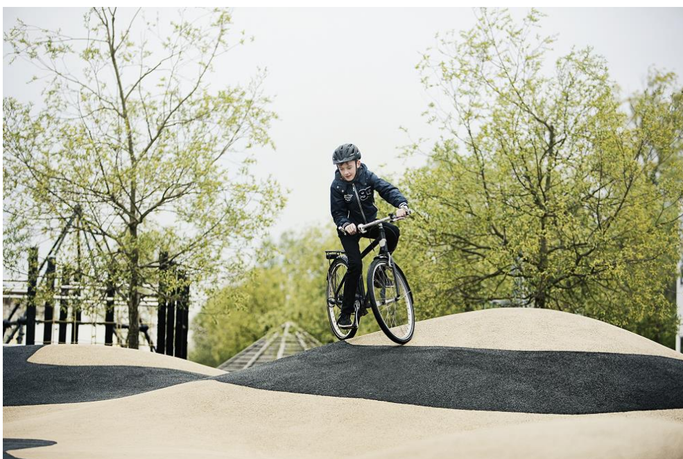
De 10 nye cykellegebaner kommer til at byde på udfordringer for både store og små.

Gennem cykelleg bliver cyklen som en naturlig forlængelse af kroppen – og det giver overskud både til at huske færdselsregler, aflæse vejen og holde øje med andre trafikanter, når man senere hen skal ud og øve sig i trafikken, så man med tiden kan blive trafikikker. Samtidigt giver den sjove cykeloplevelse børnene lyst til at cykle mere og styrker dermed den danske cykelkultur.