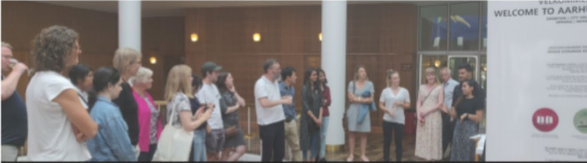
Center for Mobilitet og Urbane Studier (C-MUS), Aalborg Universitet