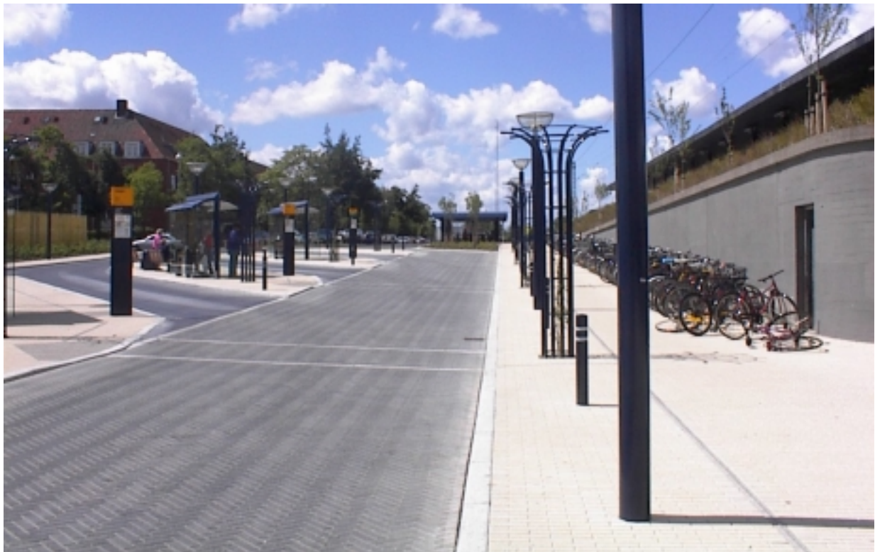
Stationsforpladsen i Buddinge. Til højre ses gennemgående ledelinie. I midten det omtalte udkørselsareal. Til venstre ses busperroner med nedsænkede kantsten og opmærksomhedsfelter.

Projektet omfatter en renovering af den eksisterende lille forplads samt en omlægning af Buddingevej forbi stationen med anlæg af nye stoppesteder. Stoppestederne på Buddingevej benyttes af flere busser end stoppestederne i den egentlige terminal.