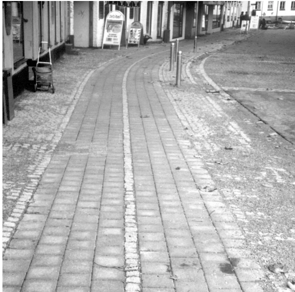
Gangbane og ledelinie i Frederikssund-projektet.

Projektet omfatter ombygning af gaderne Østergade og Havnegade til sivegader, dvs. gader hvor gang- og køreareal ikke er adskilt med kantsten, men kun med en vandrende udført i brosten. Denne gadetype er ikke optimal for blinde og svagsynede, som normalt har brug for et kantstensopspring at orientere sig efter med stok eller førerhund.