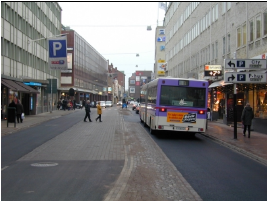
Figur 2. Djäknegatan i riktning mot Centralen. Typsektionen är 3,0 m gångbana+3,0 m körbana+0,5 m längsremsa+3,0 m busskörväg+1,5 m längsremsa+3,0 m körbana+3,0 m gångbana