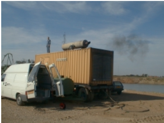
Generator testes under normalt arbejde. Bemærk "røgskyen", som opstår kortvarigt, når motoren belastes.

På nogle køretøjer kan man belaste motoren ved at sætte i gear, holde på bremsen og give fuld gas samtidig. Motoren belastes op mod momentomformeren, som kortvarigt kan aftage belastningen. Andre køretøjer belastes bedre f.eks. ved acceleration af køretøjet fra stilstand til en given hastighed, men så skal man måle under kørsel. Maskiner, f.eks. generatorer, belastes ved at lade maskinen udføre sit normale arbejde.