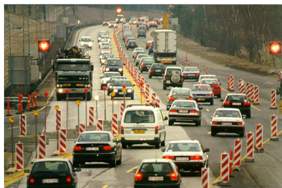
Figur 7. Variable hastighedstavler ved vejarbejde.

Rigspolitiet har startet et projekt som handler om digitale fartskiver for store køretøjer [16].