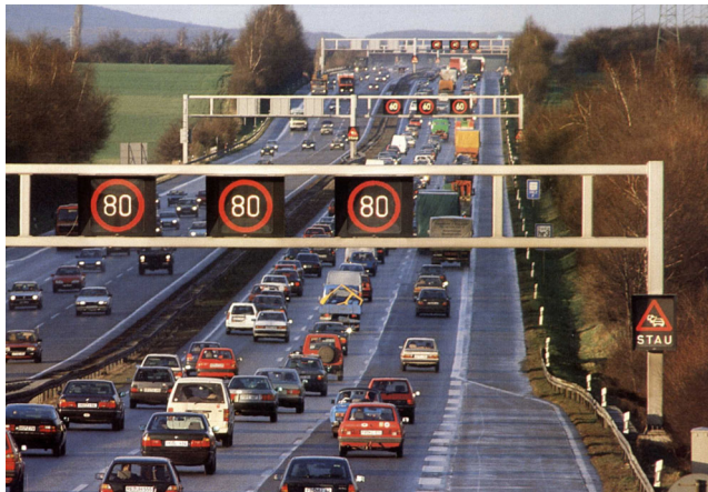
Figur 3. Variable tavler.

Et simulatorforsøg i Storbritannien gav en estimeret effekt på antal dødsulykker på 18 – 59 % afhængig af, hvor frivilligt den intelligente farttilpasning var – desto mere obligatorisk systemet er, desto bedre effekt har systemet på antallet af ulykker. Et Hollandsk forsøg har givet et fald i antal personskader på 15 % og 21 % fald i antal dræbte.