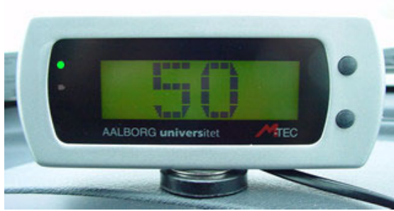
Figur 3. Intelligent Farttilpasning [7].

I Børkop Kommune planlægges et projekt med hastighedstilpasning. INFATI er et projektnavn for Intelligent Farttilpasning. Dette er et trafikinformatiksystem, som fortæller føreren af et køretøj hvis den pågældende hastighedsgrænse overskrides. Projektet skal gennemføres i de to største bysamfund Børkop og Brejning. Forprojektet skal afklare, hvorvidt det er muligt at få 15 % af projektområdets køretøjer, svarende til ca. 300 køretøjer, til at køre med INFATI. Herudover skal forundersøgelsen præcisere organisering og