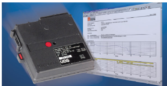
Figur 5. Sort boks.

Færdselsstyrelsen arbejder med et 1-årigt forprojekt om sorte bokse. Planen er at installere bokse i 50 mindre busser til handicaptransport. Der vil blive etableret en kontrolgruppe på 50 handicapbusser uden bokse. Boksen reagerer på "hændelser" såsom høj acceleration/ deceleration. Bokserne aflæses hver måned. Et af spørgsmålene er, hvordan indførelse af sorte bokse fungerer organisatorisk i en virksomhed. Herudover skal det undersøges om virksomheden sparer penge ved færre skader, mindre brændstofforbrug og mindre slitage. Det er tale om et