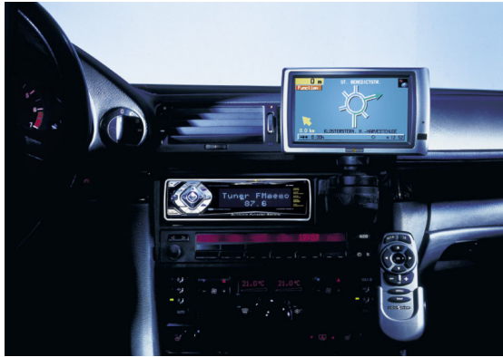
Figur 2. Rutevejledningssystem.

Trafikledelse/-informatik, eller på engelsk Intelligent Transport Systems (ITS), er på verdensplan en af de hurtigst voksende sektorer inden for IT. ITS kan give størst mulig mobilitet inden for de rammer, som hensynet til trafikssikkerheden, miljøet og samfundet i øvrigt sætter [2].