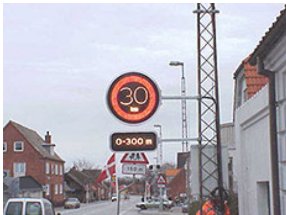
Figur 6. Variable hastighedstavler i Brovst [10].

Danmarks Transport Forskning (DTF) har afsluttet et projekt med forskning om variable hastighedstavler. Projektet fremlægges på Trafikdagene 2003 [9]. DTF planlægger desuden følgende projekter om intelligente farholdere og antikollisionssystemer, forsøg med brugergrænseflader og automatik undersøgelser af den mentale belastning for førerne [5].