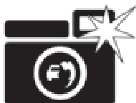
Figur 8. ATK logo

Ved udvidelsen af Motorringvejen regner Vejdirektoratet med at forbedret variabel skiltning vil føre til højere fremkommelighed og vil fremme trafikssikkerheden.