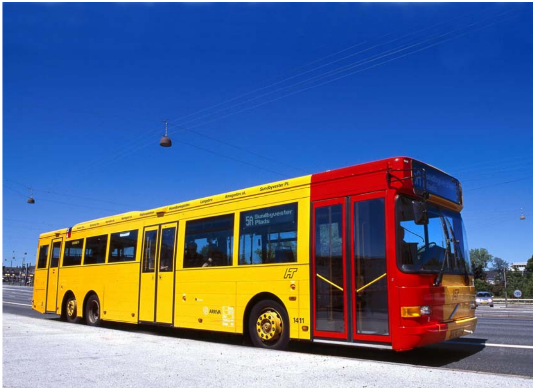
Figur 2. A-bus