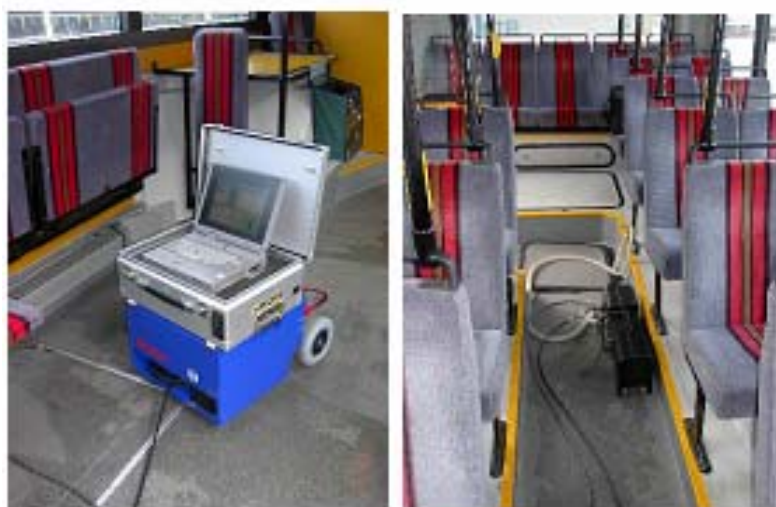
Billede 1. Måleudstyr monteret i bus. Til venstre ses 5-gas tester (blå) og batteripakke (sølvgrå), til højre ses opacitetsmåleren og slanger til bussens udstødning.

Resultaterne findes som et gennemsnit af maksimumværdierne af de tre målinger. Der måles 5-gas (CO 2 , O 2 , NO, CO og HC) og opacitet (røggastæthed – partikelemission). På basis af erfaringer fra et større antal tidligere målinger har HUR opsat grænseværdier for NO og opacitet gældende for forskellige forureningsklasser.