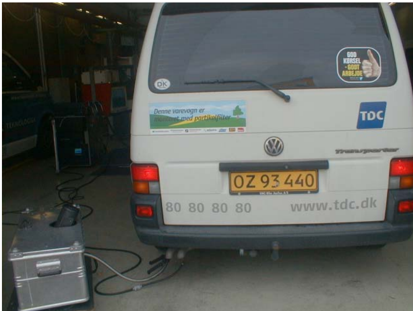
Figur 2. Varevogn fra TDC med eftermonteret partikelfilter med udstyr til måling af røggastæthed. Bemærk skiltet som gør reklame for projektet og dets deltagere.

I løbet af projektperioden udføres rutinemæssige målinger på varevognene for at undersøge filtrenes funktion. Der anvendes tre forskellige metoder med forskellig frekvens.