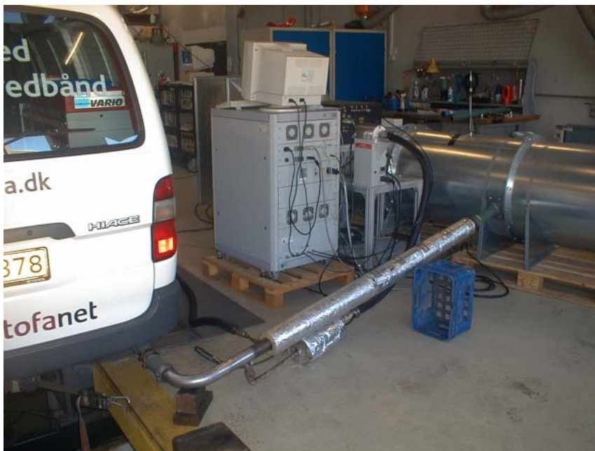
Figur 3. Varevogn fra Telia med eftermonteret partikelfilter og noget af det meget omfattende udstyr til måling af partikelmasse og partikelstørrelsesfordeling mv.

Én gang gennemføres en komplet emissionsmåling på fem udvalgte vogne med hver sin partikelfiltertype. Emissionsmålingerne udføres på rullefelt efter den standardiserede europæiske kørecyklus, og der måles en række emissioner, herunder partikelmasse og partikelstørrelsesfordeling, med laboratorieudstyr på internationalt niveau. Disse omfattende målinger giver et fuldstændigt overblik over partikelfiltrenes virkningsgrad.