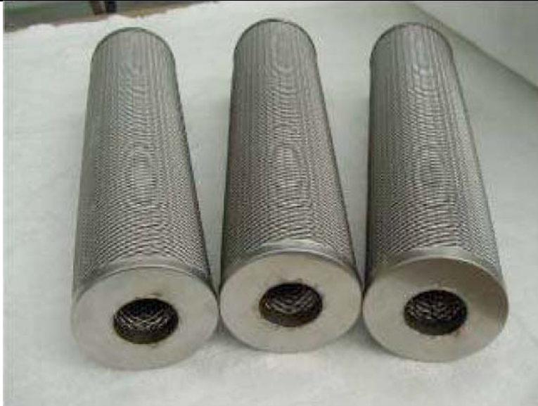
Figur 1. Fiber partikelfiltre (CPO - Catalytic Particulate Oxidizer).

Systemerne følges nøje, idet driftserfaringer registreres af entreprenøren og bearbejdes af Teknologisk Institut. Samtidigt udføres der hver anden måned måling af røggastæthed, og hvert halve år udføres Miljøsyn for at overvåge emissionerne. Én varevogn af hver type gennemgår desuden omhyggelige emissionsmålinger efter ca. et års drift.