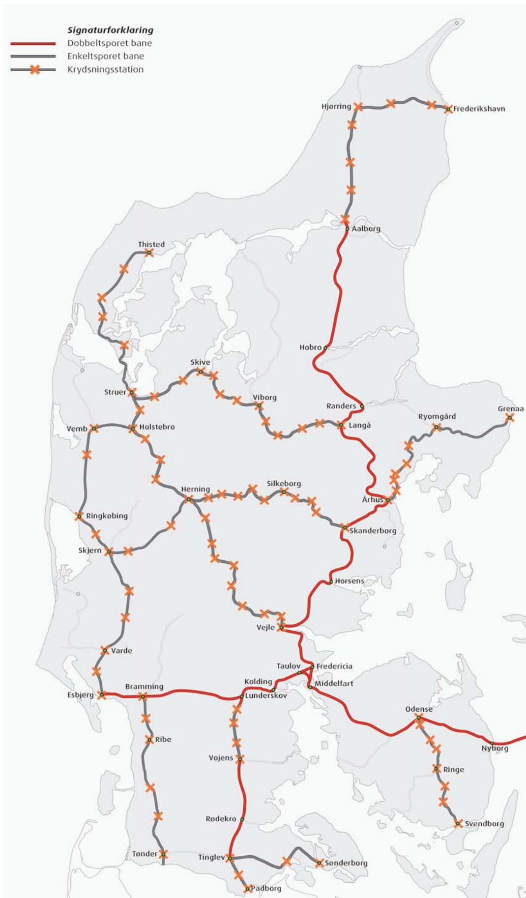
Fig. 2 Krydsningsstationer på regionalbanerne i dag