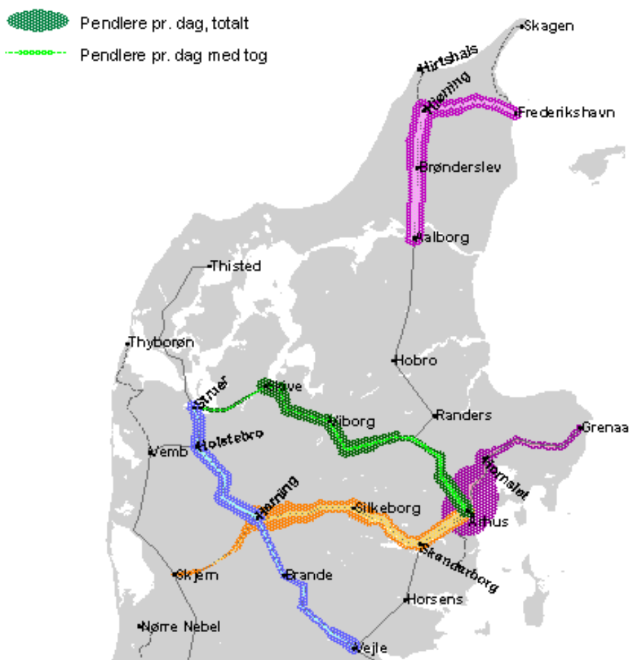
Fig. 6 Togpendlere og totalt antal pendlere i fem korridorer

På korte afstande og til/fra relativt mindre samfund synes toget at stå svagt. Men på længere afstande og til/fra de større byer synes toget at stå relativt stærkt. En forklaring kan dels ses i trængsel på vejnettet ved de større byer, dels at typiske togrejsende som studerende især er bosat i de større bysamfund. På de kortere afstande udgør busbetjening ofte en væsentlig del af den samlede kollektive tog- og busbetjening.