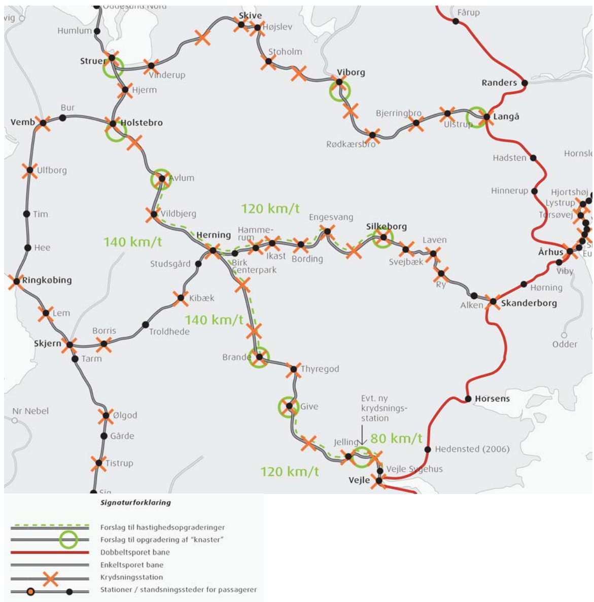
Fig. 3 Midtjylland – skitse til opgraderinger og 'knaster'

Der er beregnet en meget høj samfundsøkonomisk forrentning for dette projekt på i størrelsesordenen 20 % - 30 % (hhv. 90 % og 10 % fraktil).