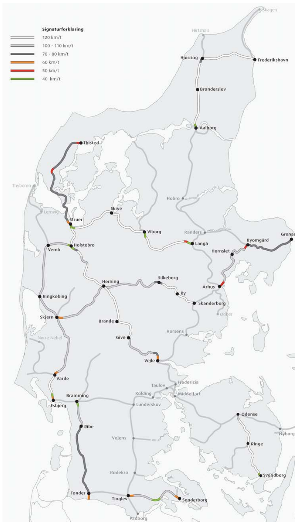
Fig. 1 Hastigheder på regionalbanerne i dag.