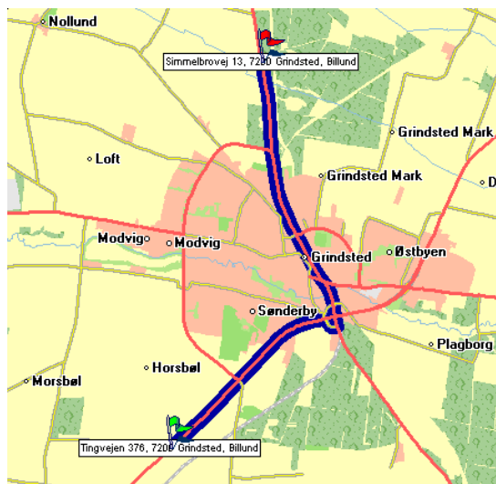
Figur 1. Den blå rute er beregnet på grundlag af NAVTEQ's digitale vejnet, mens den røde streg i midten er tegnet på grundlag af KMS nettet.

De første test af sammenfaldet mellem KMS og NAVTEQ viser overraskende god overensstemmelse mellem de to korts placering af vejene. Et eksempel vises i figur 1 nedenfor.