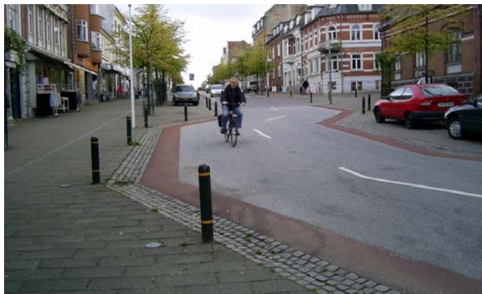
Figur 2. Adelgade i Skanderborg. Et eksempel på en projektlokalitet, hvor asfalkørebanelen er bevaret.