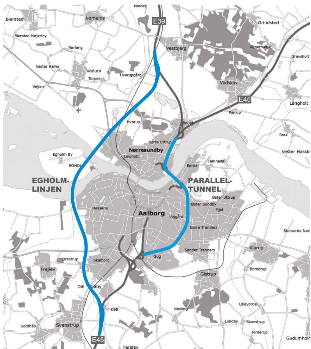
Figur 2. Egholmlinjen og Østforbindelsen.