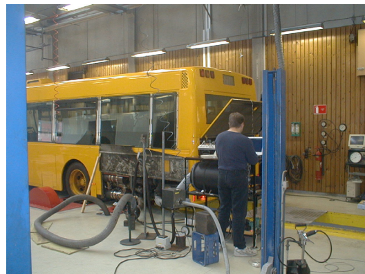
Test ved Teknologisk, Århus 12 juni 2003

Det der gør kombinationen mellem et katalytisk partikelfilter og et SCR system, som omtalt ovenfor, yderligere attraktiv er, at qua, det høje reduktions potentiale i SCR teknologien, gives der mulighed for at dieselmotoren kan justeres til at arbejde mere "magert".