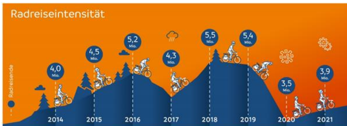
Fig 1: Udvikling i antal cykelturister fra 2014-2021. ADFC 2022, side 6

Cykelturismen i Tyskland toppede med 5,5 millioner cykelturister i 2018-19, men faldt derefter pga. pandemien. En-dags-rejser, enkeltovernatninger og weekendrejser er ikke med i disse tal, men disse rejser steg kraftigt under og efter pandemien, og man forventer, at denne tendens fortsætter. Halvdelen af alle tyskere (41,6 millioner tyskere) tog på mindst en dagstur på cykel i 2021. Alt i alt blev der foretaget omkring 441 million dagsture på cykel i 2021.