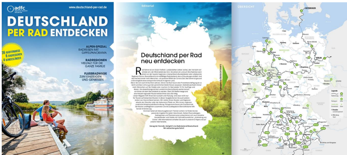
Fig 3: Forsiden og første opslag af magasinet "Deutschland per rad entdecken (Opdag Tyskland på cykel) 2021.

De regionale turistorganisationer står for markedsføring af de enkelte ruter. Men siden 1999 har ADFC, det tyske cyklistforbund, sikret uafhængig formidling af cykelturisme i Tyskland. De producerer bl.a. magasinet "Deutschland per Rad entdecken" (Opdag Tyskland på cykel), hvor de samler information om de forskellige tyske ruter og tilbud på tværs af de forskellige delstater. Magasinet findes både som trykt og online magasin.