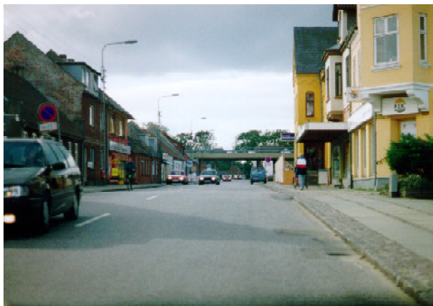
Vejbroen danner en uskøn port i byen, og generne fra den højtliggende vej er betydelige

Formålet med idéoplægget er at tilpasse hovedlandevejen til den fremtidige trafik, som efter motorvejens ibrugtagning bliver væsentlig mindre. Det er tanken at give trafikanterne en bevidst oplevelse af landskabets topografi, den stedlige arkitektur og egnstypiske karakteristika på tværs af Jylland. Den samlende idé for projektet er formuleret som 'Den kul-