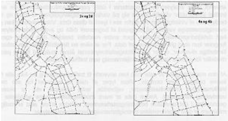
Figur 1 De to sut alternative Havnetunnelprojekter. 2c og 2d der fortsættes ned af en opgraderet Amager strandvej samt 4a og 4b hvor Amager strandvej trafiksaneres og Kløvermarksvej forlænges med Lossepladsvej.

Oa: 'Do-minimum' hvor vejnettet er udgangsnettet uden en Havnetunnel.