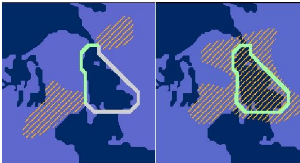
Figur Fejl! Ukendt argument for parameter.: Visionen om en Øresundsringbane.

Visionen med den faste HH-jernbaneforbindelse er en Øresundsringbane Helsingør – København – Malmö – Helsingborg – Helsingør, hvor en rejse Øresund rundt kan gennemføres på præcis 2 timer. Det vil hermed betyde at alle rejsemål i regionen kan nås på højst 1 time. Dette betyder samtidig at forbindelsen ud fra et pendlingsperspektiv er særdeles interessant.