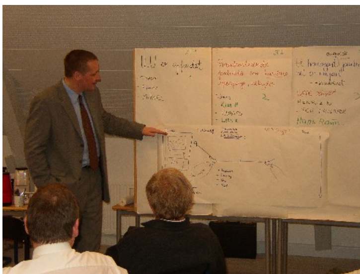
Figur 3 Det forklares hvordan man forestiller sig et standardiseret og kundeorienteret kombitransportudbud kan se ud i 2008