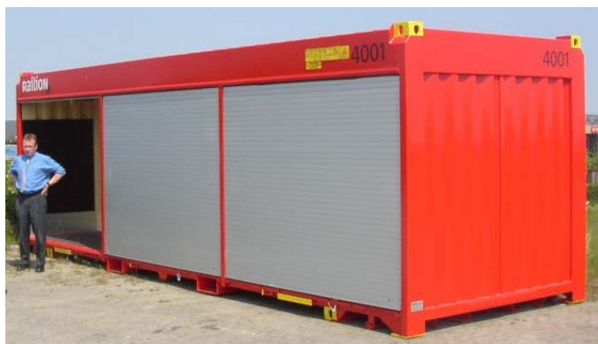
Figur 2 Railions nyudviklede container, som med ydre mål der passer til såvel vej- som jernbanetransport, indre mål, der er tilpasset europallen og med mange håndteringsmuligheder kan opfattes som et bud på en Intermodal Loading Unit (ILU)

Det har været en voldsom omvæltning for virksomheden, at den har skullet fungere på normale markedsvilkår, men med en række markante projekter har virksomheden vist at den også kan arbejde i denne nye sammenhæng. En række shuttleforbindelser mellem vest (Taulov, Esbjerg, Århus, Aalborg) og øst (Høje Tåstrup og Hålsingborg) er blevet åbnet og kører med god belægningsgrad på trods af de relativt korte strækninger. Et samarbejde med Carlsberg