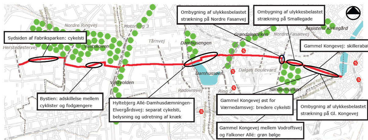
Fabriksparken – Bystien – Rødovre Parkvej – Hyltebjerg Allé – Finsensvej – Nordre Fasanvej – Smallegade – Gl. Kongevej

Albertslundruten løber både langs større byveje og ad separate stier. På byvejene er der ofte krydsende sideveje. På ruten er der blandt andet fundet behov for nye cykelstier samt mulighed for at etablere en grøn bølge for cyklister.