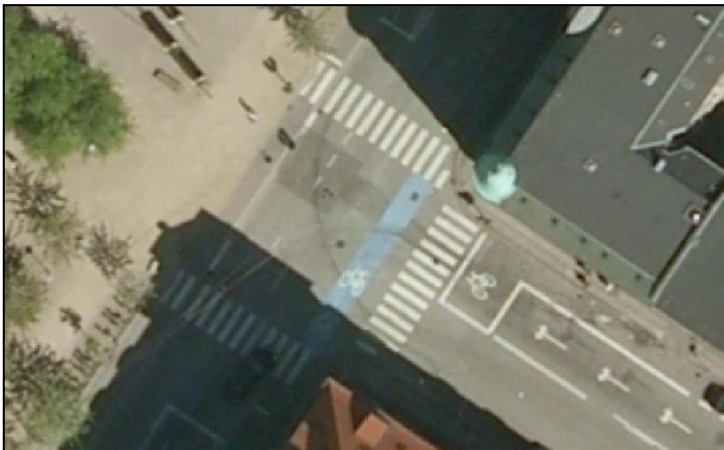
Figur 2: Luftfoto fra cykellomme på Njalsgade – Islands Brygge