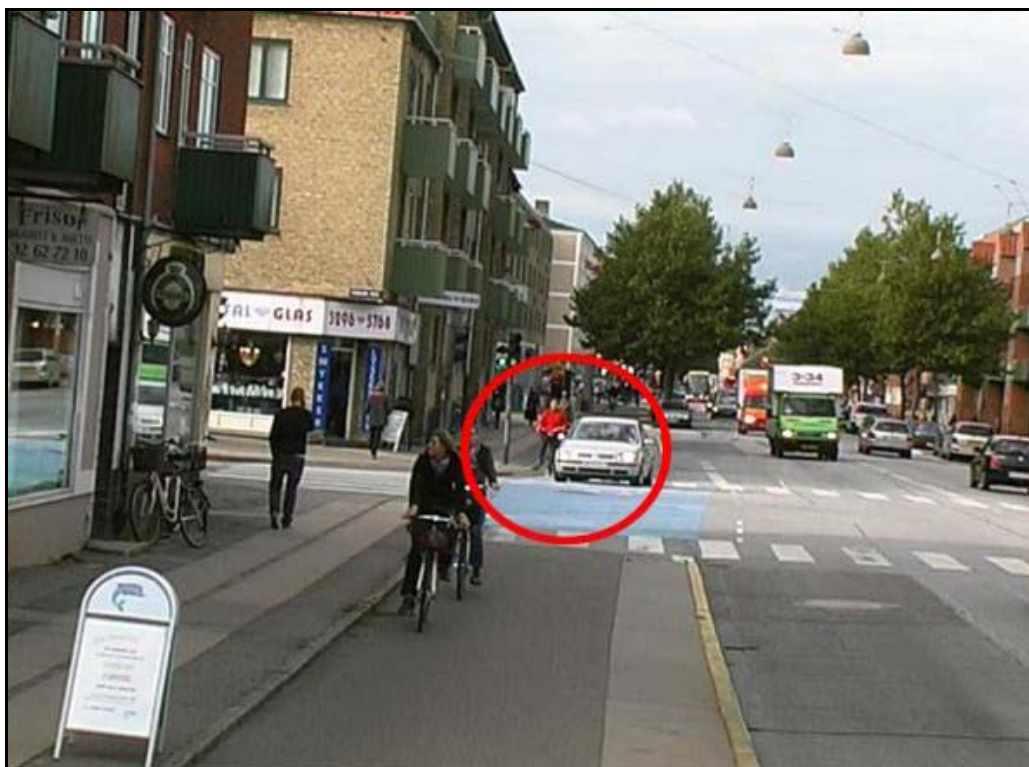
Figur 4: Foto af mindre alvorlig konflikt i før-perioden på Amagerbrogade

Hvis man tæller op, så har Trafitec registreret 5 alvorlige konflikter og 2 let før, og 5 alvorlige efter, på Amagerbrogade. Dette kan indikere at det er noget mere sikkert efter ombygningen. Men det er ikke et soleklart billede, da man kan se af tabellen, som viser antallet af konflikter før og efter ombygning. Hvis man ser på hvilke typer af konflikter der er registreret så kan man til gengæld se, at de fordeler sig noget forskelligt før sammenlignet med efter. Der er lidt flere med lette trafikanter og færre med kun biler.