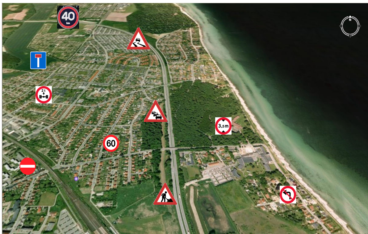
Eksempel på digitalt vejnet med geometri og statiske og dynamiske attributter

Forprojektet skal vise, om Det Digitale Vejnet kan skabe en harmonisering mellem udvalgte administrative vejdata (registerdata) og et geografisk baseret referencesystem for vejmidterne, der beskriver geometri, stedfæstelse, topologi og administrativ vejID.