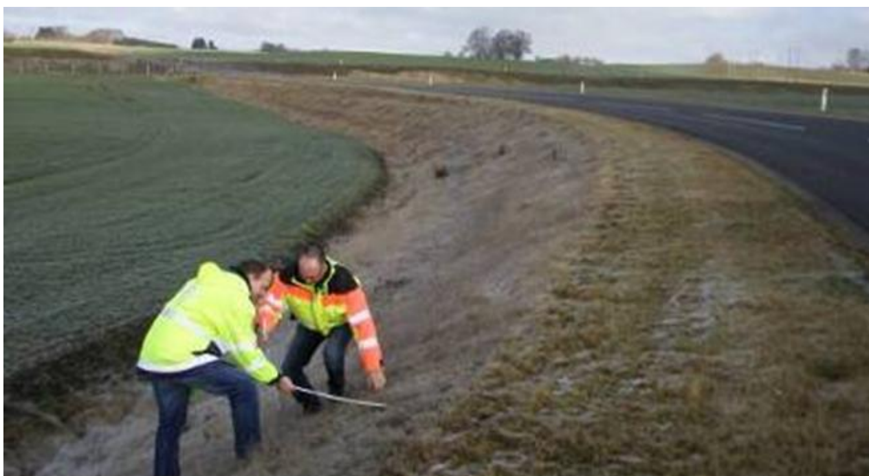
Besigtigelse af et ulykkessted

Besigtigelsen gennemføres så vidt muligt inden for 1-2 uger efter ulykkestidspunktet.