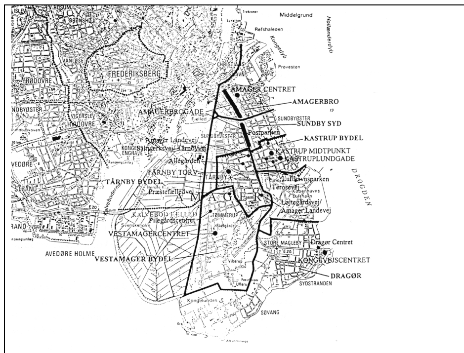
Figur 4. Områder på Amager med nuværende bydels- og lokalcentre.

Institut for Center-Planlægning har interviewet godt 1000 kunder, der besøgte Tårnby Torv en torsdag og en lørdag. Kunderne oplyste, hvorfra de kom før besøget, og hvortil de skulle bagefter, samt den valgte transportmåde.