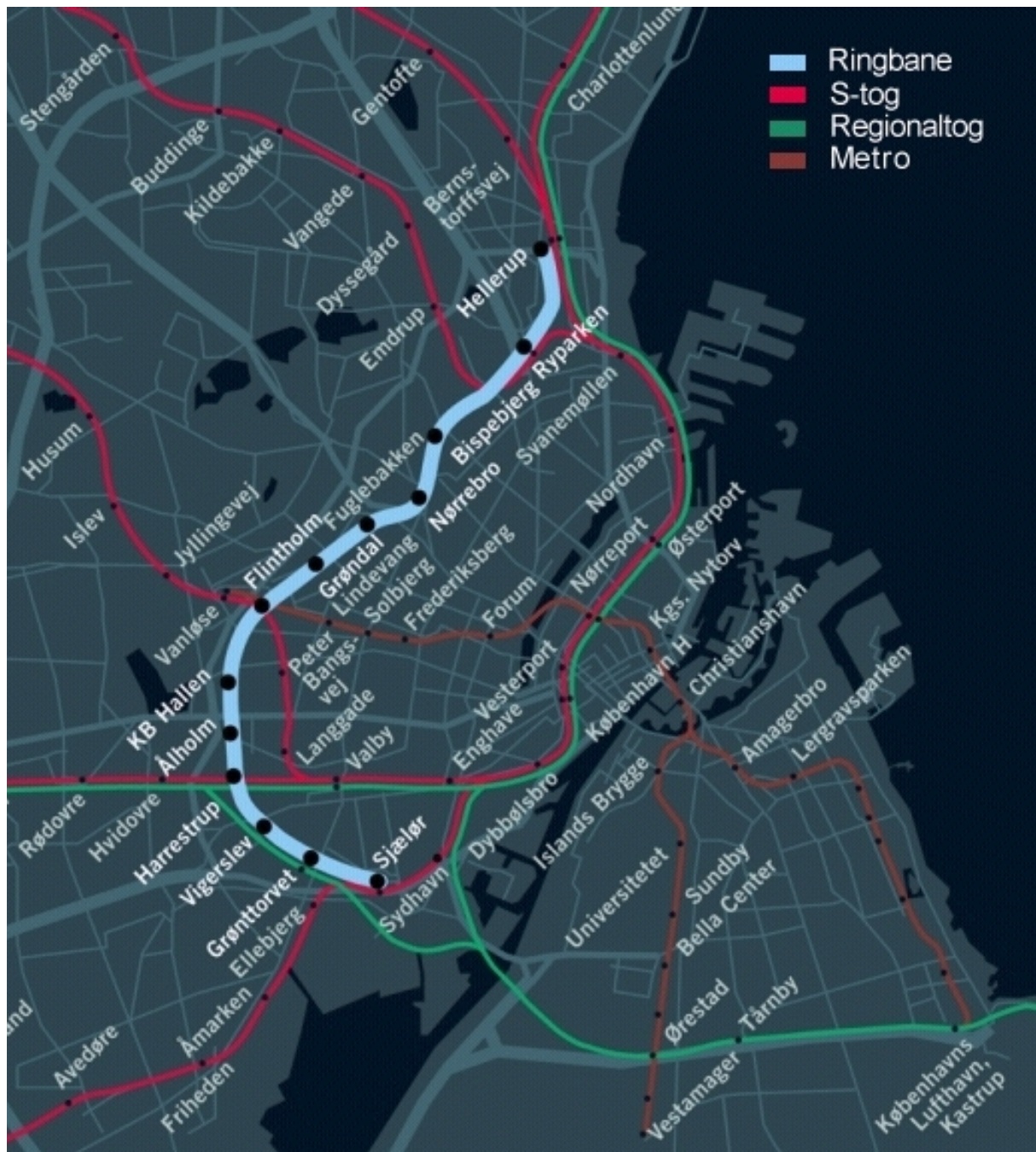
Fig. 1: Ringbanens linieføring